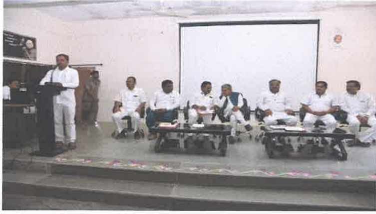
प्रास्ताविक करतांना प्रा. नानवटे. एन. एन. व इतर मान्यवर