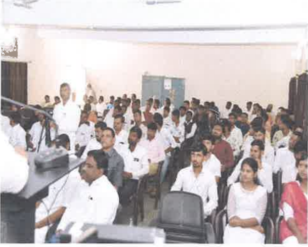
अर्थशास्त्र सेमिनार मध्ये उपस्थित सर्व प्राध्यापक व विद्यार्थी